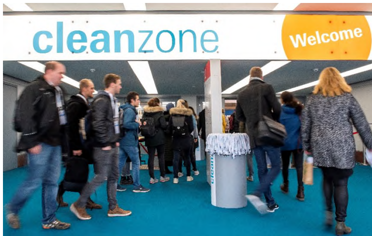
Die Cleanzone öffnet nach zwei Jahren wieder Türen für Aussteller und Besucher*innen.